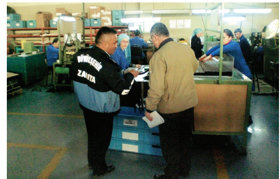
Tablo 7. Zabita Ekipleri ile Yapılan İşyeri Denetimleri (Adet)